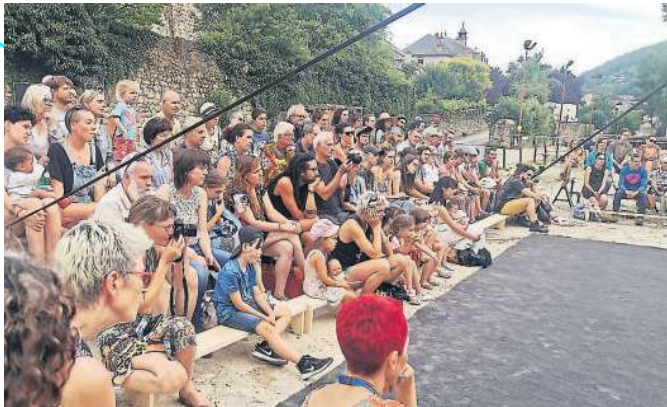
Les spectacles se déroulent au pied du château d'Entraygues avec un public au plus proche des artistes