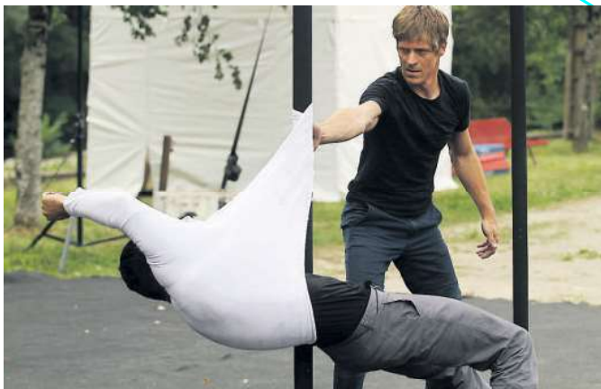
Le duo Translations est venu présenter en première de son nouveau spectacle au mât chinois