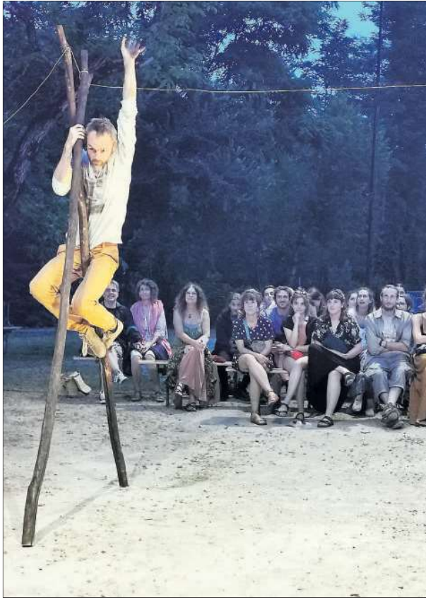
Un fil de fer, des perches de bois et Miettes se lance dans un spectacle qui enthousiasme le public